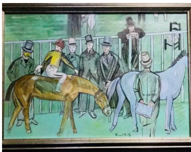
« Le pesage » par Dufy, 38 x 55 cms