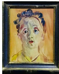
« Portrait de Berthe » par Dufy, 26 x 21 cms

Des dessins originaux de Cocteau et de Dali seront également proposés.