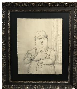
« Homme con un libro » par Botero, 45,8 x 36,5 cms

L'ACRN mettra en vente au cours de la soirée les œuvres originales suivantes, dont le profit sera intégralement reversé à la cathédrale :