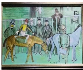
« Le pesage » Дюфи, 38 x 55 см