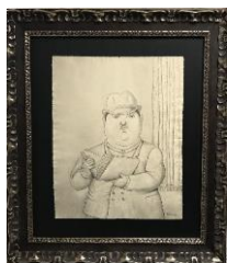
« Hombre con un libro » Ботеро, 45,8 x 36,5 см

Ассоциация ACRN - «Друзья Русского Собора в Ницце» - представит к продаже нижеуказанные художественные произведения на аукционе в течение гала-вечера, средства от которого полностью будут переданы в пользу Собора: