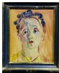
« Portrait de Berthe » Дюфи, 26 x 21 см

Вашему вниманию будут также предложены оригинальные рисунки Кокто и Дали.