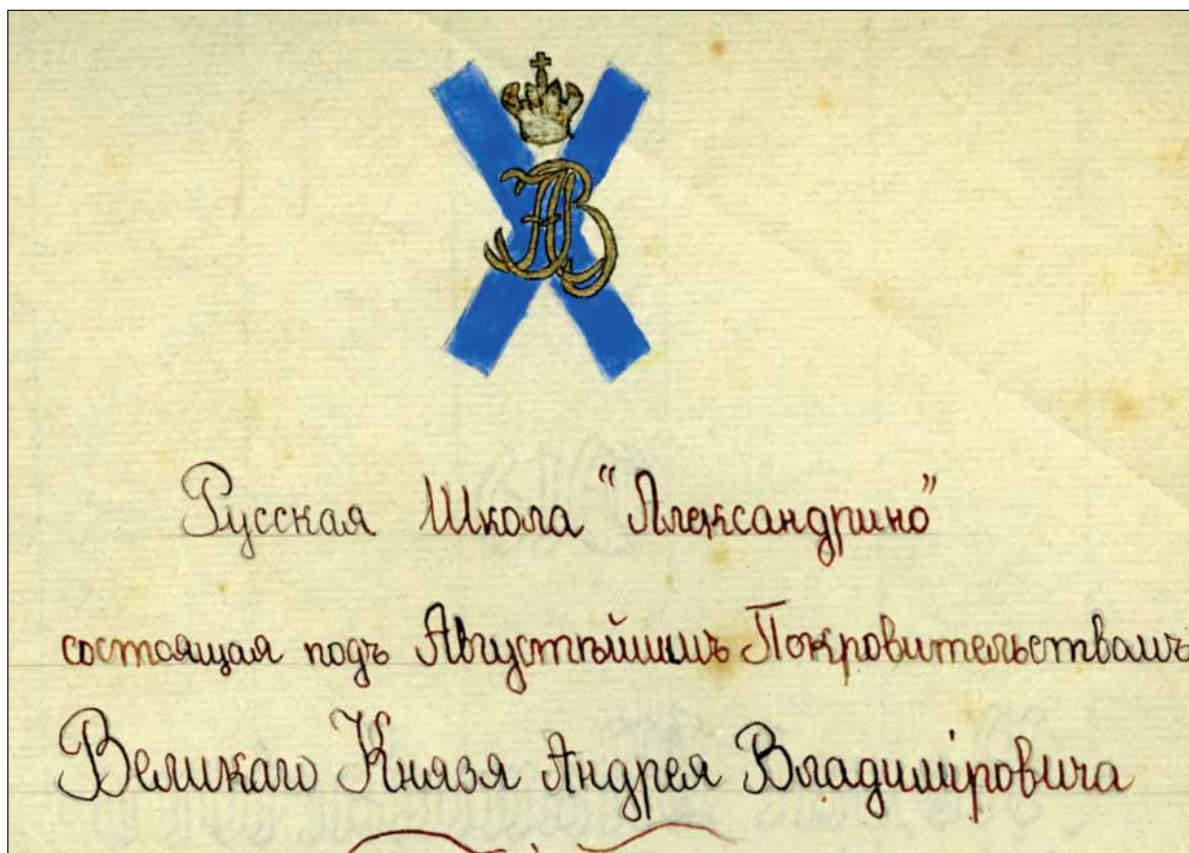
Эмблема школы «Александрино»

О существовавшей в 1920–1930-х годах в Ницце русской школе под таким названием