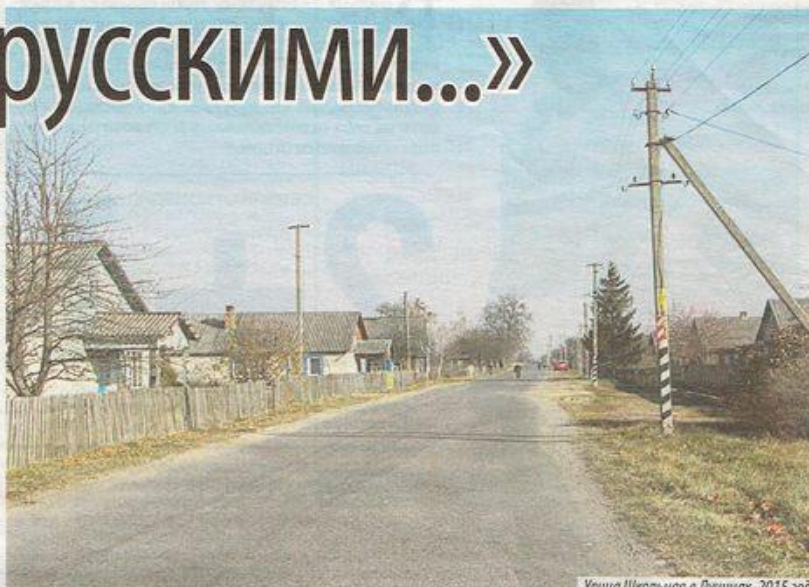
Улица Школьная в Лучицах, 2015 год