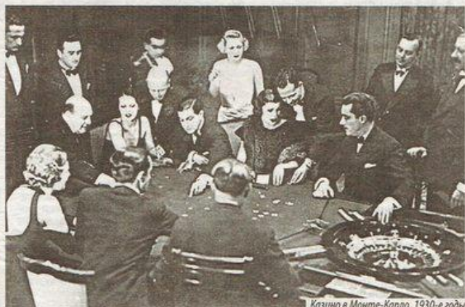
Казино в Монте-Карло, 1930-е годы