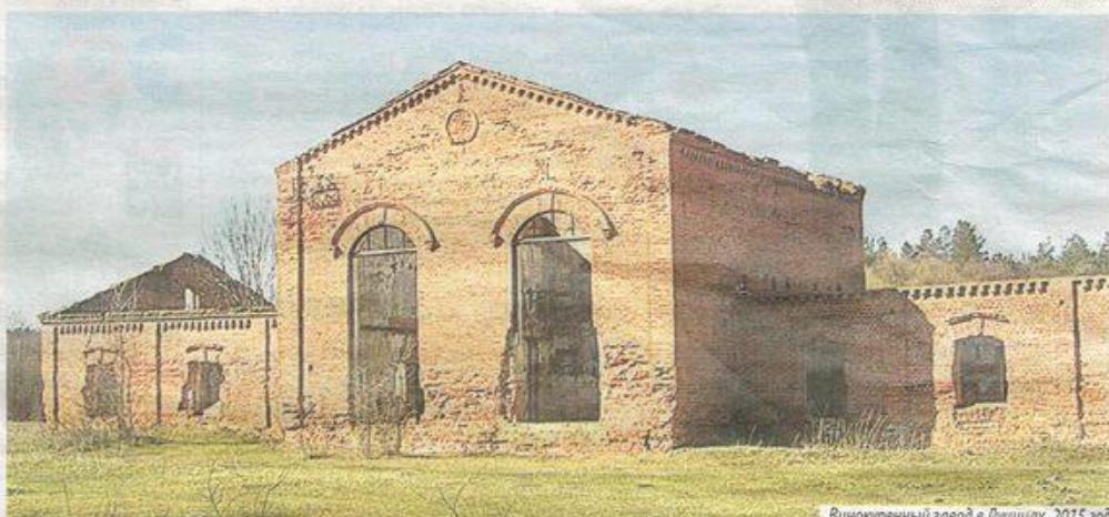
Винокурный завод в Лучицах, 2015 год