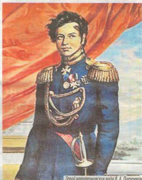
Герой наполеоновских войн Я. А. Потемкин